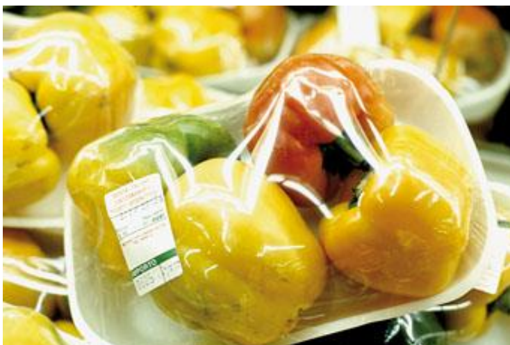
Nino Migliori, Natura morta

El fotógrafo boloñés se dirige hacia lo informal movido por la exigencia de probar una alteración de la trama de lectura, de la estructura asimilada. La fotografía es un encuentro entre la imagen y lo que está metabolizado en ella.