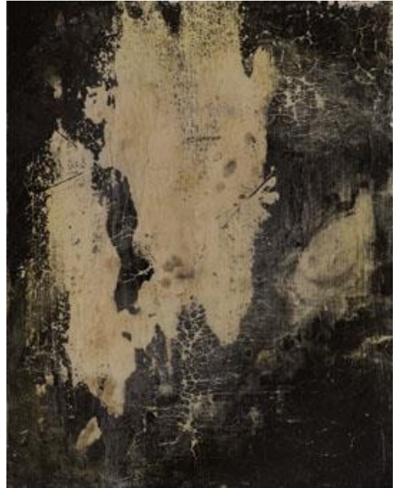
Nino Migliori, Ossidazione

Por último, cabe mencionar una de sus obras más recientes es muy importante para comprender la poética del artista: se trata del conjunto de imágenes fotográficas realizadas en el cementerio de los niños de la Cartuja de Bolonia. El fotógrafo apunta que las tumbas de los niños están llenas regularmente de juguetes y muñecos, testigos de la relación cotidiana que los padres siguen manteniendo con sus pequeños difuntos. Esta ritualidad permite una posible reflexión sobre la propia naturaleza de la imagen y sus significados simbólicos. Escribe a propósito de esto el psicoanalista Serge Tisseron: