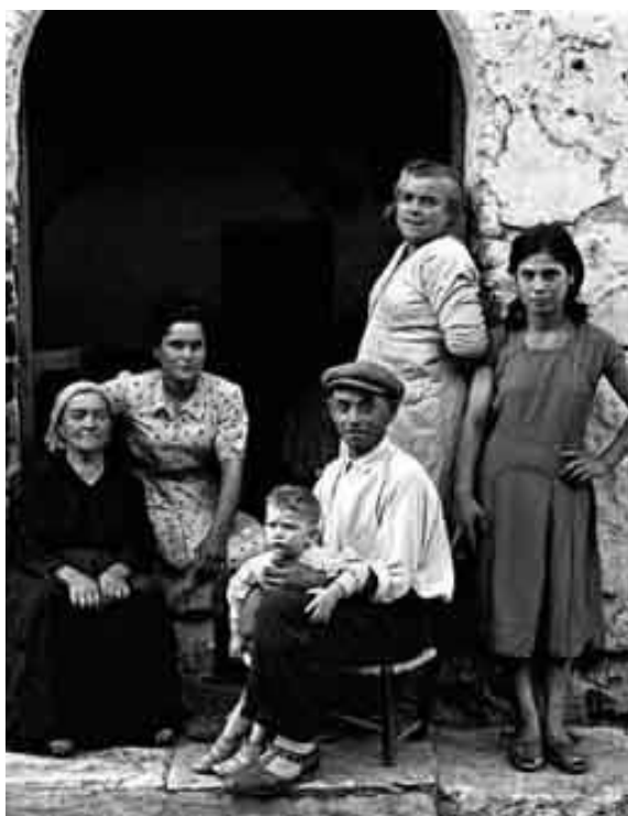
Nino Migliori, Gente del Sud

Reconstruyendo desde el principio la compleja carrera de este artista es posible situar sus inicios al final de los años cuarenta, al final de la guerra, en una Bolonia maltratada por las operaciones bélicas. En este período, Migliori intenta, por una parte, volver a adueñarse de su ciudad documentando los espacios cotidianos en los que le toca vivir y trabajando, al mismo tiempo, en imágenes obtenidas sin utilizar la máquina de fotos y en imágenes realizadas con un estilo que podríamos aproximar al neorrealismo fotográfico 1 .