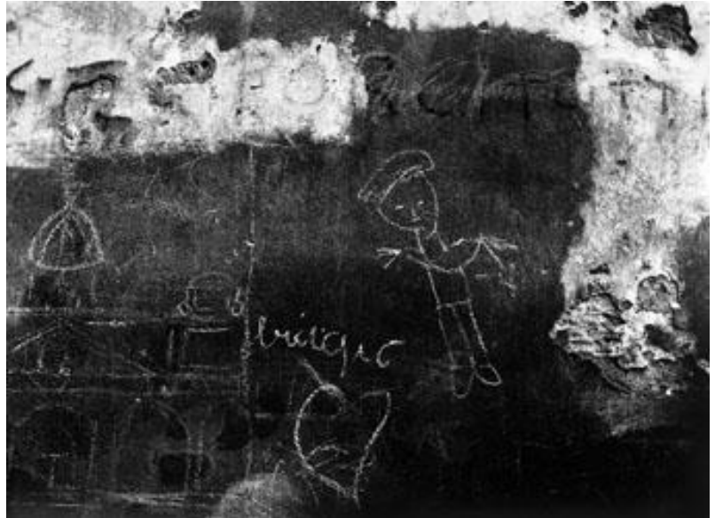
Nino Migliori, Muro

De esta forma, el fotógrafo boloñés se acerca con el paso de los años cada vez más al arte conceptual, desarrollado en los años sesenta, y a una estrategia en la que la imagen fotográfica juega con su condición potencial de grabación casual de una acción artística, de la que, sin embargo, está destinada a ser el producto final. Este acercamiento supone un acto de creación artística que comienza mucho antes de que la máquina esté preparada para disparar, ya que comienza con el diseño de la idea, con el pensamiento visual.